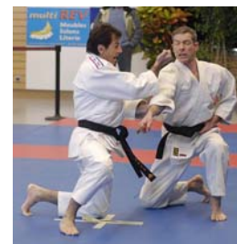
Images d'entraînement et de la Coupe 2011