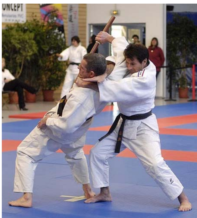
Coupe technique de katas de judo de Mâcon le samedi 24 mars 2012